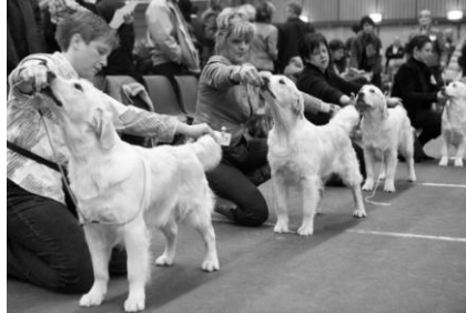
Derde prijs Martien Coppensprijz 2010: 'Schoonheidswedstrijden', gefotografeerd door Leo van Kuik en Leo Kwinten