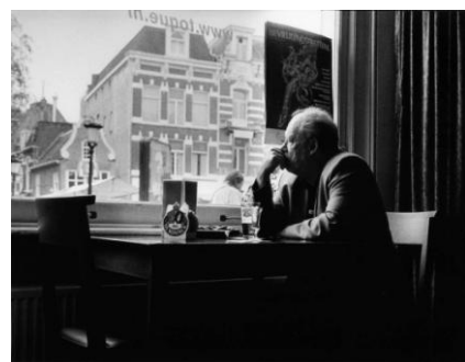
Eerste prijs Martien Coppensprijs 2010: 'Er was eens een leuk café in Utrecht', gefotografeerd door De VerBEELDing 811

De prijs is genoemd naar de inmiddels ook internationaal bekende Brabantse fotograaf Martien Coppens (1908 – 1986) . Een groot vakman en vooral bekend als documentaire fotograaf. Van zijn hand verschenen tientallen fotoboeken. Een groot deel zijn werk is ondergebracht in het Nederlands Fotomuseum en de Brabant-Collectie van de Universiteit van Tilburg .